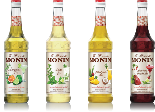
Margarita Mix 마가리타 믹스 마가리타를 쉽고 빠르게 제공 Mojito Mix 모히토 믹스 신선한 민트의 향과 라임의 산미 Pina Colada Mix 피나콜라다 믹스 파인애플의 달콤함과 부드러운 코코넛의 조화 Strawberry Daiquiri Mix 스트로베리 다이키리 믹스 진한 스트로베리 향과 상큼한 라임의 조화