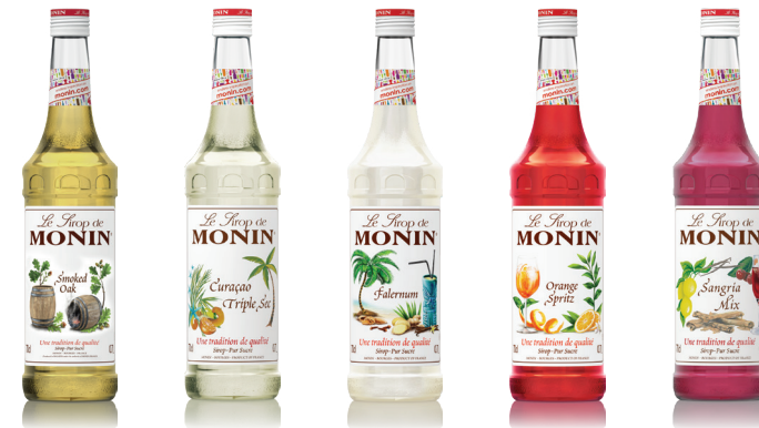
Smoked Oak 스모크드 오크 달콤한 바닐라 향과 훈연 향이 어우러진 시럽 New Curacao Triple Sec 큐라소 트리플 섹 상큼한 오렌지 껍질의 풍미 Falernum 팔라넘 Tiki 칵테일의 필수 재료 Orange Spritz 오렌지 스프릿 오렌지의 풍부한 과즙과 오렌지 껍질의 풍미 Sangria Mix 상그리아 상그리아의 맛과 향을 풍부하게 표현