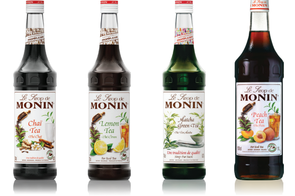
Chai Tea 차이티 인도 정통 차이티를 완벽히 재현 Lemon Tea 레몬티 상큼한 레몬과 홍차의 깊은 풍미 Matcha Green Tea 마차 그린티 싱그러운 녹차의 풍미 Peach Tea 피치티 달콤한 복숭아와 홍차의 깊은 풍미