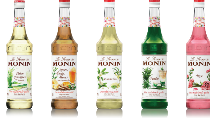
Lemongrass 레몬그라스 독특한 허브향과 은은한 시트러스 향 New Lemon Ginger Honey 레몬 진저 허니 레몬 진저 허니 믹스 Osmanthus 오스만투스 우아하고 은은한 오스만투스의 향 Pandan 판단 카야잼의 재료인 판단으로 만든 시럽 Rose 로즈 향기로운 장미의 향