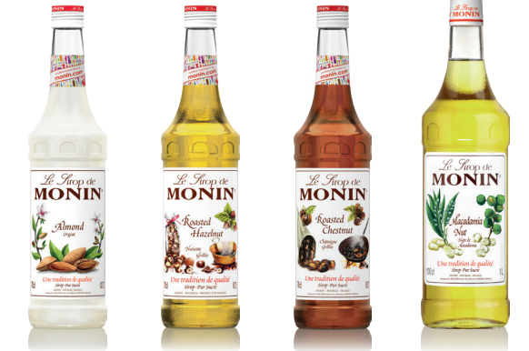
Almond 아몬드 Tiki 칵테일의 필수 재료 Roasted Chestnut 로스티드 체스트넛 구운 밤의 깊은 풍미 Toasted Almond 토스티드 아몬드 구운 아몬드의 깊은 풍미 Macadamia Nut 마카다미아 넛 고소한 마카다미아 넛의 향