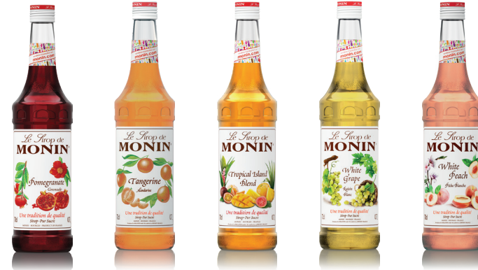
Pomegranate 파미그레닛 새콤달콤한 석류의 맛 Tangerine 텐저린 감귤류 껍질의 풍미와 상큼한 과즙의 맛 Tropical Island Blend 트로피칼 아일랜드 블렌드 복합적인 열대과일의 풍부한 맛 White Grape 화이트 그레이프 새콤달콤한 청포도의 맛 White Peach 화이트 피치 플로럴하고 달콤한 백도의 맛과 향