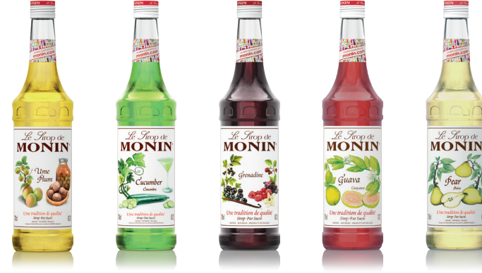
Ume Plum 플럼 플로럴하고 달콤한 플럼의 맛과 향 New Cucumber 큐컴버 시원하고 상쾌한 오이의 향 Grenadine 그레나딘 선명한 붉은 컬러가 특징인 믹스베리의 맛 Guava 구아바 이국적이고 풍부한 열대의 맛 Pear 배 서양배의 향긋함