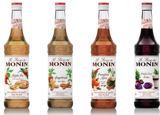
Apple Pie 애플파이 사과와 갓 구운 페스츰리의 달콤함 Gingerbread 진저브레드 넛맥과 시나몬이 첨가된 진저브레드 쿠키맛 Pumpkin Spice 펌킨 스파이스 향신료 향이 더해진 호박의 맛 Purple Sweet Potato 자색고구마 잘 익은 달콤한 군고구마의 향