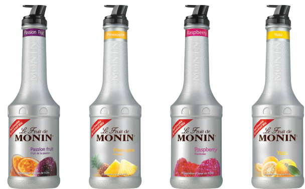
Passion Fruit 패션프룻 새콤달콤하고 향긋한 패션프룻의 맛